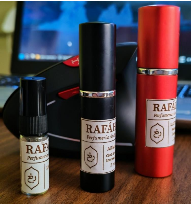
Ejemplo de presentaciones en: 3mL (vidrio) – 5mL (premium) – 10 mL (Premium)